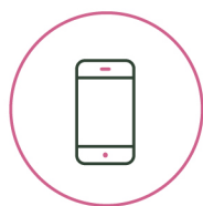
A DIGITALIZAÇÃO E A NUVEM