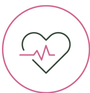
SAÚDE E BEM-ESTAR